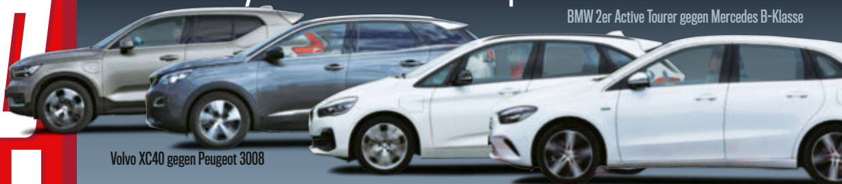
Volvo XC40 gegen Peugeot 3008

BMW 2er Active Tourer gegen Mercedes B-Klasse